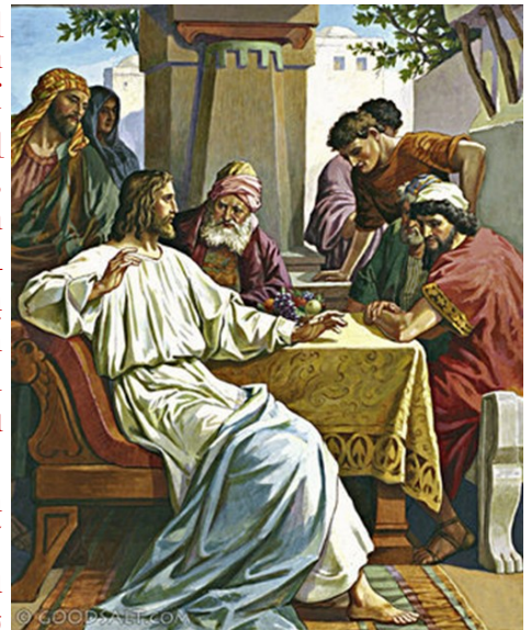
Christ at the Table of Pharisee

Ինք ըսաւ անոր. «Մարդ մը սարքեց մեծ ընթրիք մը, ու հրաւիրեց շատ մարդիկ: Ընթրիքի ժամուն՝ որկեց իր ծառան, որպէսզի ըսէ հրաւիրեալներուն. “Եկէ՛ք, որովհետեւ արդէն ամէն բան պատրաստ է”: Բոլորն ալ միաբերան սկսան հրաժարիլ: Առաջինը ըսաւ անոր. “Ես արտ մը գնեցի, եւ հարկ է որ մեկնիմ ու տեսնեմ գայն. կը խնդրեմ քեզմէ, հրաժարած նկատէ զիս”: Միւսը ըսաւ. “Հինգ գոյգ եզ գնեցի, եւ կ’երթամ որ փորձարկեմ գանոնք. կը խնդրեմ քեզմէ, հրաժարած նկատէ զիս”: Միւսը ըսաւ. “Կնոջ մը հետ ամուսնացայ. ուստի չեմ կրնար գալ”: Ծառան եկաւ ու պատմեց իր տիրոջ այս բաները: Այդ ատեն տանուտերը բարկացաւ եւ ըսաւ իր ծառային. “Շուտով դուրս ելի՛ր՝ դէպի քաղաքին հրապարակներն ու փողոցները, եւ հո՛ս բեր աղքատները, պակասաւորները, կաղերն ու կոյրերը”: Ծառան ալ ըսաւ. “Տէ՛ր, կատարուեցաւ ինչ որ հրամայեցիր, բայց տակաւին տեղ կայ”: Տէրը ըսաւ ծառային. “Դո՛ւրս ելի՛ր դէպի ճամբաներուն գլուխներն ու ցանկապատերը, եւ հարկադրէ՛ գտածներդ՝ որ հոս մտնեն, որպէսզի տունս լեցուի”: Որովհետեւ, կ’ըսեմ ձեզի, այդ հրաւիրուած մարդոցմէն ո՛չ մէկը պիտի ճաշակէ իմ ընթրիքս»: