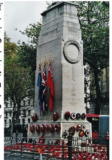
The Cenotaph at Whitehall, London on Remembrance Day 2004

The initial Armistice Day was observed at Buckingham Palace, commencing with King George V hosting a "Banquet in Honour of the President of the French Republic" [3] during the evening hours of 10 November 1919. The first official Armistice Day was subsequently held on the grounds of Buckingham Palace the following morning. During the Second World War, many countries changed the name of the holiday. Member states of the Commonwealth of Nations adopted Remembrance Day, while the US chose Veterans Day.