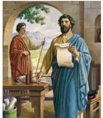
Paul Writes to Corinthians

Ո՛ր է իմաստունը, ո՛ր է դպիրը, ո՛ր է այս աշխարհի վիճաբանողը. միթէ Աստուած չիմարացո՞ւց այս աշխարհի իմաստութիւնը: Արդարեւ՝ քանի աշխարհը իր իմաստութեամբ չճանչցաւ Աստուած՝ անոր իմաստութեան մէջ, Աստուած բարեհաճեցաւ քարոզութեան յիմարութեամբ փրկել անոնք՝ որ կը հաւատան. որովհետեւ Հրեաները նշան կը պահանջեն, եւ Յոյները իմաստութիւն կը փնտռեն, իսկ մենք կը քարոզենք խաչեալ Քրիստոսը, գայթակղութիւն՝ Հրեաներուն, ու յիմարութիւն՝ Յոյներուն. բայց անոնց որ կանչուած են, թէ՛ Հրեաներուն եւ թէ՛ Յոյներուն, Քրիստոսը՝ Աստուծոյ զօրութիւնը եւ Աստուծոյ իմաստութիւնը.