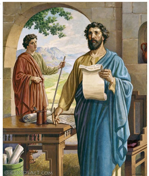
Paul Writes to Corinthians

Արդարեւ Աստուծոյ ուզած տրտմութիւնը կը պատճառէ՝ ապաշխարութիւն՝ փրկութեան համար, որ չի գոջացներ. բայց աշխարհի տրտմութիւնը կը պատճառէ մահ: Քանի դուք տրտմեցաք Աստուծոյ ուզած կերպով, ահա՛ այդ բանը ձեր մէջ ի՛նչ փութաջանութիւն գոյացուց, նոյնիսկ ջատագովութիւն, ընդվզում, վախ, տենչանք, նախանձախնդրութիւն, վրէժխնդրութիւն. ամէն կերպով դուք ձեզի հաւանութիւն տուիք թէ այդ խնդիրին մէջ անկեղծ էք: Ուրեմն ինչ որ գրեցի ձեզի, ո՛չ թէ անիրաւութիւնը ընողին պատճառով էր, եւ ո՛չ ալ անիրաւութիւնը կրողին պատճառով, հապա՛ որպէսզի երեւնայ ձեզի Աստուծոյ առջեւ մեր ունեցած փութաջանութիւնը ձեզի հանդէպ: Ուստի ձեր մխիթարութեամբ մենք մխիթարուեցանք. եւ ա՛լ աւելի ուրախացանք Տիտոսի ուրախութեան համար, որովհետեւ անոր հոգին հանգստացած էր բոլորէր. քանի որ ամօթահար չեմ ըլլար՝ ձեզմով որեւէ բանի մէջ պարծենալուս համար անոր առջեւ. հապա, ինչպէս ամէն բան ճշմարտութեամբ խօսեցանք ձեզի, նոյնպէս Տիտոսի առջեւ մեր պարծանքն ալ ճշմարիտ գտնուեցաւ: Նաեւ իր գորովը աւելի առատ է ձեզի հանդէպ, մինչ կը վերյիշէ ձեր բոլորին հնազանդութիւնը, թէ ի՛նչպէս ահով ու դողով ընդունեցիք զինք: Ուստի կ'ուրախանամ որ ամէն բանի մէջ վստահութիւն ունիմ ձեր վրայ: