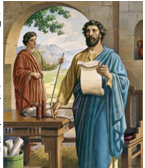
Paul Writes to Corinthians

Ուրեմն, սիրելիներ, այս խոստումները ունենալով՝ մաքրե՛նք մենք մեզ մարմինի ու հոգիի ամէն տեսակ պղծութենէ, եւ կատարելագործե՛նք սրբացումը Աստուծոյ վախով: