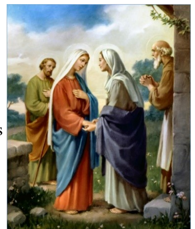
Mary Visits Elizabeth

he has scattered those who are proud in their inmost thoughts.