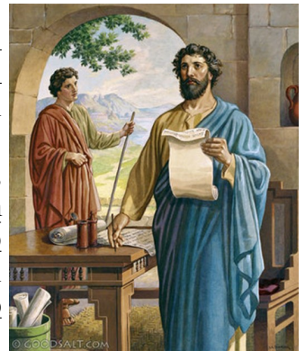
Paul Writes to Corinthians

Օրհնեա՛լ ըլլայ Աստուած, մեր Տէրոջ՝ Յիսուս Քրիստոսի Հայրը, արգահատանքի Հայրը եւ ամէն միախթարութեան Աստուածը, որ կը միախթարէ մեզ մեր ամբողջ տառապանքին մէջ, որպէսզի մենք կարենանք միախթարել անոնք՝ որ որեւէ տառապանքի մէջ են, այն միախթարութեամբ՝ որով մենք կը միախթարուինք Աստուծմէ. որովհետեւ ինչպէս Քրիստոսի չարչարանքները կ'առատանան մեր մէջ, նմանապէս մեր միախթարութիւնն ալ կ'առատանայ Քրիստոսի միջոցով: Եթէ տառապանք՝ ձեր միախթարութեան եւ փրկութեան համար է, որ արդիւնաւոր կ'ըլլայ՝ համբերելով այն նոյն չարչարանքներուն, որոնցմով մենք ալ կը չարչարուինք. ու եթէ միախթարուինք՝ ձեր միախթարութեան եւ փրկութեան համար է: Մեր յոյսը հաստատուն է ձեր վրայ, որովհետեւ գիտենք թէ ինչպէս հաղորդակից էք մեր չարչարանքներուն, նոյնպէս ալ միախթարութեան պիտի ըլլաք: