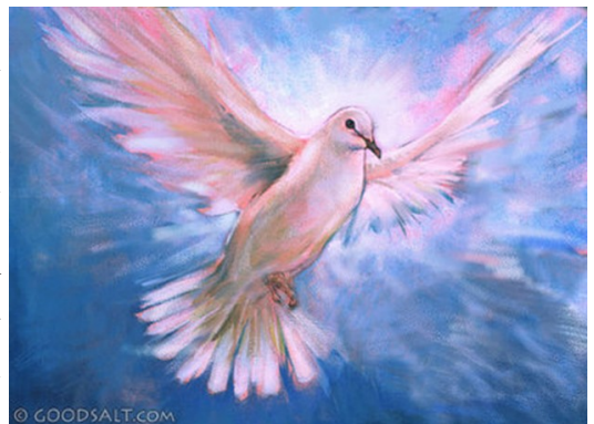
White Spirit Dove In Flight

Այս բաները խօսեցայ ձեզի, քանի դեռ կը մնամ ձեր քով: Բայց Մխիթարիչը՝ Սուրբ Հոգին, որ Հայրը պիտի դրկէ իմ անունովս, անկեալ՝ պիտի սորվեցնէ ձեզի ամէնը, եւ ինչ որ ըսի ձեզի՝ պիտի յիշեցնէ ձեզի: Իսաղաղութիւն կը թողում ձեզի, ի՛մ խաղաղութիւնս կու տամ ձեզի. ես չեմ տար ձեզի ա՛յնպէս՝ ինչպէս աշխարհը կու տայ: Ձեր սիրտը թող չվրդովի ու չերկնչի: Լսեցիք թէ ըսի ձեզի. “Ես կ’երթամ, բայց դարձեալ պիտի գամ ձեզի”: Եթէ սիրէիք զիս, պիտի ուրախանայիք՝ որ ես կ’երթամ Հօրը քով, որովհետեւ իմ Հայրս ինձմէ մեծ է: Եւ այժմէն՝ դեռ չեղած՝ ըսի ձեզի, որպէսզի երբ ըլլայ՝ հաւատար: Ա՛լ շատ պիտի չխօսիմ ձեզի հետ, որովհետեւ այս աշխարհի իշխանը կու գայ. բայց ո՛չ մէկ հեղինակութիւն ունի իմ վրաս: Սակայն աշխարհը թող զհստայ թէ ես կը սիրեմ Հայրը, եւ կ’ընեմ ա՛յնպէս՝ ինչպէս Հայրը պատուիրեց ինձի: Ուրի՛ ելէք, երթա՛նք ասկէ»: