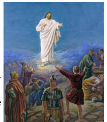
Christ the Light and Life of Men

He came into the very world he created, but the world didn't recognize him. He came to his