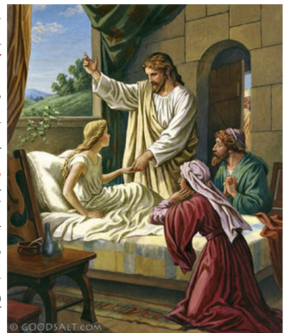
Jairus' Daughter Restored to Life

Երբ ինք ղեռ կը խօսէր, ժողովարանի պետին տունէն մէկը եկաւ եւ ըսաւ. «Աղջիկդ մեռաւ, ա՛լ մի՛ անհանգստացնէր վարդապետը»: Բայց երբ Յիսուս լսեց ապիկա՝ ըսաւ անոր. « Մի՛ վախնար, միայն հաւատա, ու պիտի ապրի »: Երբ տունը մտաւ, ո՛չ մէկուն թոյլ տուաւ որ մտնէ, բայց միայն՝ Պետրոսի, Յակոբոսի ու Յովհաննէսի, եւ աղջիկին հօր ու մօր: Բոլորն ալ կու լային եւ կը հեծեծէին անոր վրայ. բայց ինք ըսաւ. « Մի՛ լաք. ան մեռած չէ, հապա կը քնանայ »: Անոնք ալ զինք ծաղրեցին, քանի զիտէին թէ մեռաւ: Իսկ ինք բոլորն ալ դուրս հանելով՝ բռնեց անոր ձեռքէն, ու գոչեց՝ ըսելով. « Աղջի՛կ, ոտքի՛ ելիր »: Անոր հոգին վերադարձաւ, եւ ան անմիջապէս կանգնեցաւ: Յիսուս հրամայեց՝ որ անոր ուտելիք տան: Անոր ծնողները զմայլած մնացին, եւ ինք պատուիրեց անոնց՝ որ պատահածը ո՛չ մէկուն ըսեն: