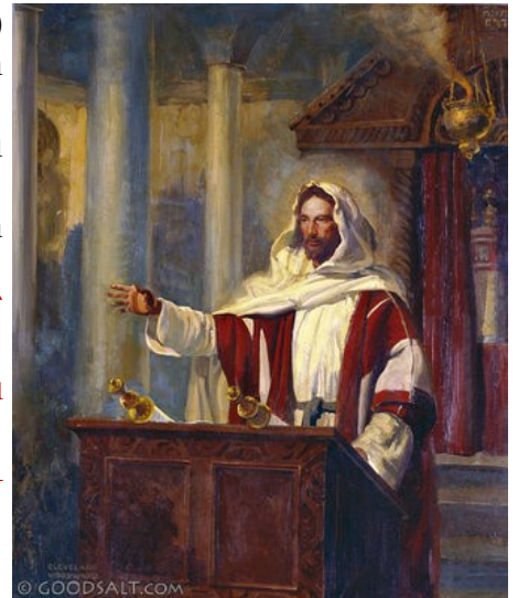
Jesus in the Synagogue in Nazareth

– Անտարակոյս ինծի պիտի ըսէք հետեւեալ առածը. «Բժիշկ, դուն քեզ բժշկէ»: Եւ ինչ որ լսեցինք որ գործեր եւ Կափառնաւումի մէջ, այստեղ՝ քու հայրենի գաւառիդ մէջ ալ կատարէ: Եւ անեցուց. – Բայց դուք ալ գիտէք, որ մարգարէն իր ծննդավայրին մէջ յարգ չունի: