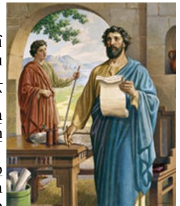
Paul Writes to Corinthians

Մեր զգացած մխիթարութեան վրայ Տիտոս ասելի՛ եւս ուրախացուց մեզ, ուրախութեամբ պատմելով թէ ինչպէս բոլորդ ալ գոհ ձգած էք զինք: Ձեզի համար պարծանքս յայտնած էի իրեն, եւ ամօթով չմնացի. եւ ինչպէս ձեզի խօսածներս բոլորը ճշմարիտ էին, նոյնպէս ալ Տիտոսի յայտնած պարծանքս ճշմարտուեցաւ: Գիտէ՞ք թէ որքան