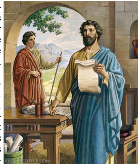
Paul Writes to Corinthians

Now this is our boast: Our conscience testifies that we have conducted ourselves in the world, and especially in our relations with you, with integrity b and godly sincerity. We have done so, relying not on worldly wisdom but on God's grace.