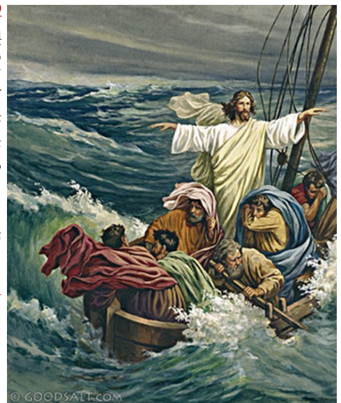
Christ Stills the Tempest

Ըսաւ անոնց. «Ինչո՞ւ այդպէս երկչոտ էք. ի՞նչպէս կ'ըլլայ՝ որ հաւատք չունիք» :