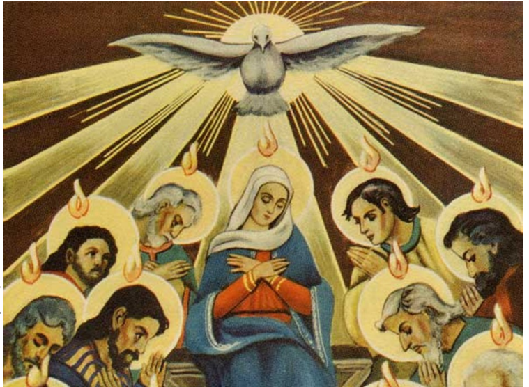
Celebrating Pentecost Day: The Birthday of the Church

The Holy Spirit is one of the three persons in the Holy Trinity coexisting with, and equal to, the Holy Father and the Holy Son. During His earthly life and ministry Christ spoke to the Apostles about the coming of the Holy Spirit. Recording the words of Christ, St. John writes, “The Comforter, the Holy Spirit, whom the Father will send in my name, will teach you everything and make you remember all that I have told you.” (John 14:26).