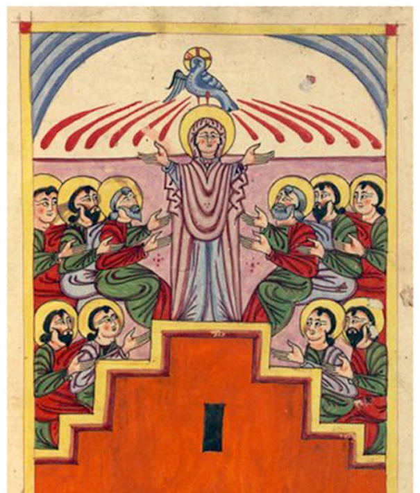
An icon depicting the Pentecost (Hokekaloust) from an Armenian manuscript dated 1455 showing the Holy Spirit above Virgin Mary and the Apostles, now in the Walters Art Museum, USA.