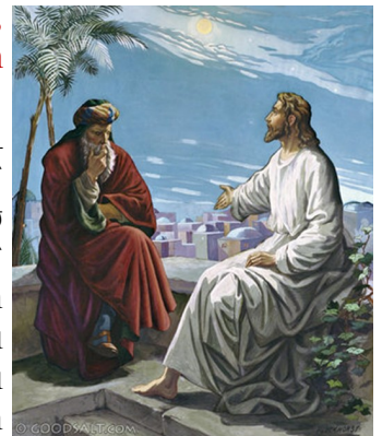
Nicodemus and Christ

Որովհետեւ Աստուած ա՛յնպէս սիրեց աշխարհը, որ մինչեւ անգամ տուաւ իր միածին Որդին, որպէսզի ո՛վ որ հաւատայ անոր՝ չկորսուի, հապա ունենայ յաւիտենական կեանքը: Քանի որ Աստուած աշխարհի որկեց իր Որդին՝ ո՛չ թէ աշխարհը դատապարտելու, հապա՛ որպէսզի աշխարհը փրկուի անով: Ա՛ն որ կը հաւատայ անոր՝ չի դատապարտուիր, իսկ ա՛ն որ չի հաւատար՝ անիկա արդէն դատապարտուած է, որովհետեւ չհաւատաց Աստուծոյ միածին Որդիին անունին: Սա՛ է դատապարտութիւնը, որ լոյսը աշխարհ եկաւ, բայց մարդիկ սիրեցին խաւարը՝ փոխանակ լոյսին, քանի որ իրենց գործերը չար էին: Որովհետեւ ո՛վ որ չարիք կը գործէ, անիկա կ'ատէ լոյսը եւ չի գար լոյսին քով, որպէսզի չկշտամբուին իր գործերը: Բայց ա՛ն որ կը կիրարկէ ճշմարտութիւնը՝ կու գայ լոյսին քով, որպէսզի իր գործերը յայտնաբերուին թէ գործուեցան Աստուծմով»: