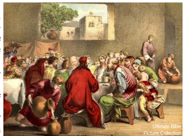
The wedding at Cana

After this he went down to Capernaum with his mother and brothers and his disciples. There they stayed for a few days.