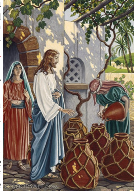
wedding in Cana

Յիսուս իր նշաններուն սկիզբը ըրաւ ասիկա՝ Գալիլեայի Կանա քաղաքին մէջ, եւ ցոյց տուաւ իր փառքը. ու իր աշակերտները հաւատացին իրեն: