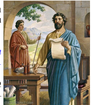
Paul Writes to Corinthians

Ուրեմն, սիրելիներ, այս խոստումները ունենալով՝ մաքրե՛նք մենք մեզ մարմնի ու հոգիի ամէն տեսակ պղծութենէ, եւ կատարելագործե՛նք սրբացումը Աստուծոյ վախով: