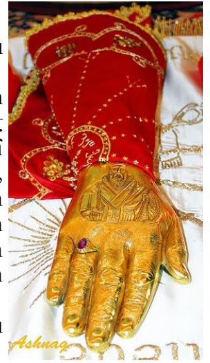
The Relics of Saint Gregory the Illuminator of Armenia

Ս. Գրիգոր Լուսավորչի նշխարները բոլոր քրիստոնեական եկեղեցիների ամենամեծ սրբություններից են: Հայոց Հայրապետի նշխարները գտնվելուց հետո նրանցից մի մասն իբրև սրբազան մասունք տարվել է Վաղարշապատ, Բյուզանդիա, Իտալիա: Մայր Աթոռ Ս. Էջմիածնում պահվող Լուսավորչի Ս. Աջը Հայ եկեղեցու կարևորագույն սրբություններից մեկն է, որով օրհնվում է սրբազան մյուռոնը: Ս. Գրիգոր Լուսավորչի նշխարների գյուտի տոնը նշվում է Հոգեգալստից հետո, չորրորդ շաբաթ օրը: Տոնի օրը եկեղեցիներում մատուցվում է Ս. Պատարագ: Տոնի առիթով Հայ եկեղեցին սահմանել է շաբաթապահք: Տոնն ունի նաև իր նախատոնակը: