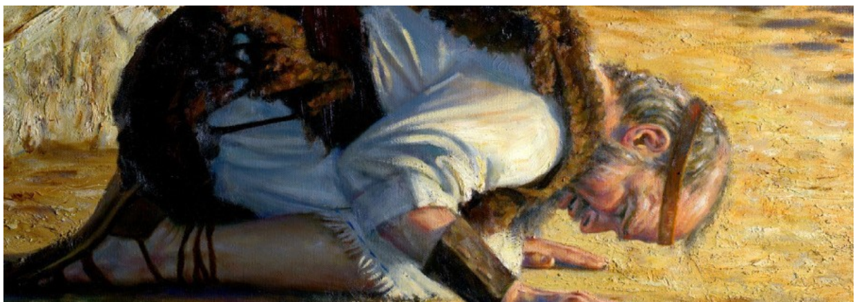
Elijah Prayed for Rain

My brothers and sisters, if one of you should wander from the truth and someone should bring that person back, remember this: Whoever turns a sinner from the error of their way will save them from death and cover over a multitude of sins.