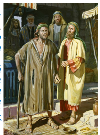
Blind man regains sight

«Ճշմարտապէս, ճշմարտապէս կը յայտարարեմ ձեզի. “Ա՛ն որ դռնէն չի մտներ ոչխարներուն բակը՝ հապա ուրիշ տեղէ կը բարձրանայ, անիկա գող եւ աւագակ է. բայց ա՛ն որ դռնէն կը մտնէ՝ ոչխարներուն հովիւն է”»: Դռնապանը կը բանայ անոր, եւ ոչխարները կը լսեն անոր ձայնը. իր ոչխարները կը կանչէ իրենց անունով ու դուրս կը հանէ զանոնք: Երբ հանէ իր ոչխարները՝ կ'երթայ անոնց առջեւէն, ու ոչխարները կը հետեւին իրեն՝ որովհետեւ կը ճանչնան իր ձայնը: Սակայն չեն հետեւիր օտարի մը՝ հապա կը փախչին անկէ, որովհետեւ չեն ճանչնար օտարներու ձայնը»: Յիսուս ըսաւ անոնց այս առակը, բայց անոնք չէին հասկնար թէ ի՛նչ էր՝ որ կը խօսէր իրենց: