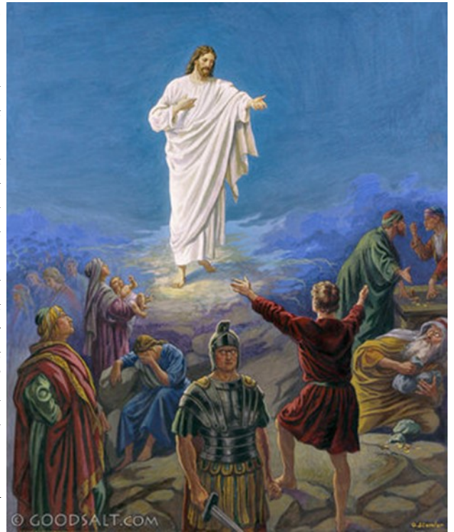
Christ the Light and Life of Men

Եւ Խօսքը մարմին եղաւ ու մեր մէջ բնակեցաւ, (եւ դիտեցինք անոր փառքը՝ Հօրը միածինի փառքին պէս), շնորհքով ու ճշմարտութեամբ լեցուն: Յովհաննէս վկայեց անոր մասին, եւ աղաղակեց. «Ասիկա՛ է ան՝ որուն մասին կ'ըսէի. "Ան որ իմ ետեւէս կու գայ՝ իմ առջեւս եղաւ, որովհետեւ ինձմէ առաջ էր": Եւ անոր լիութենէն մենք բոլորս ստացանք շնորհք շնորհքի վրայ: Որովհետեւ Օրէնքը տրուեցաւ Մովսէսի միջոցով, բայց շնորհքն ու ճշմարտութիւնը եղան Յիսուս Քրիստոսի միջոցով: