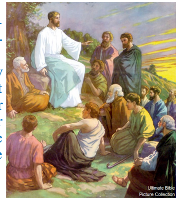
Jesus teaching the twelve

And the Lord said, “Listen to what the unjust judge says. And will not God bring about justice for his chosen ones, who cry out to him day and night? Will he keep putting them off? I tell you, he will see that they get justice, and quickly. However, when the Son of Man comes, will he find faith on the earth?”