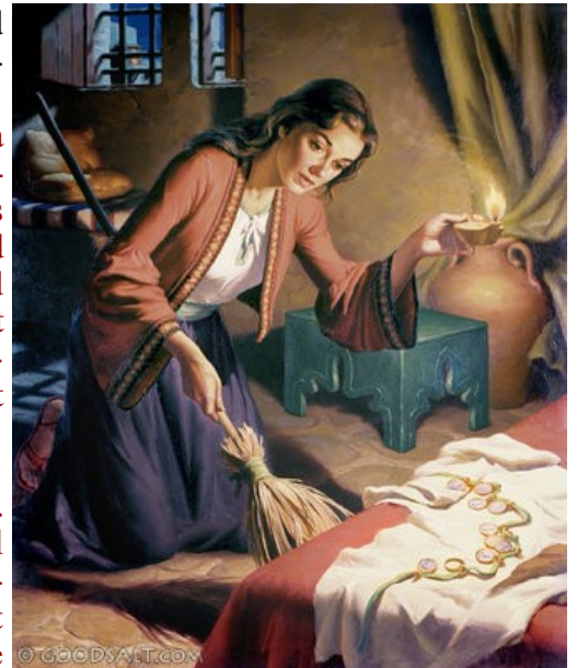
the Lost Coin

“‘My son,’ the father said, ‘you are always with me, and everything I have is yours. But we had to celebrate and be glad, because this brother of yours was dead and is alive again; he was lost and is found.’ ”