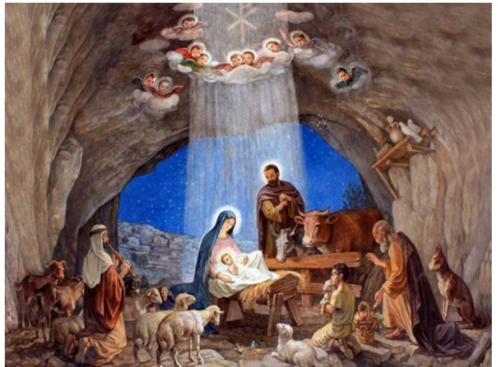
Birth of Christ

Paul, a servant of God and an apostle of Jesus Christ to further the faith of God's elect and their knowledge of the truth that leads to godliness—in the hope of eternal life, which God, who does not lie, promised before the beginning of time, and which now at his appointed season he has brought to light through the preaching entrusted to me by the command of God our Saviour, To Titus, my true son in our common faith: Grace and peace from God the Father and Christ Jesus our Saviour.