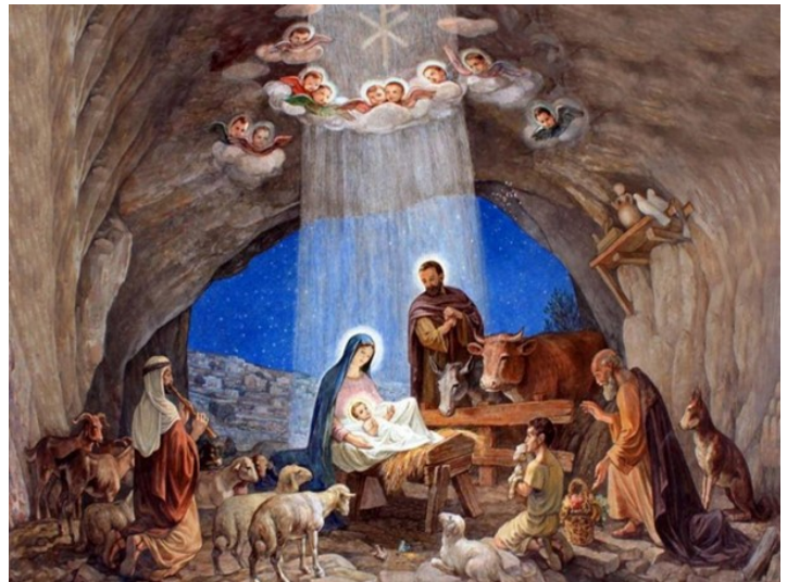
Birth of Christ

Paul, a servant of God and an apostle of Jesus Christ to further the faith of God's elect and their knowledge of the truth that leads to godliness—in the hope of eternal life, which God, who does not lie, promised before the beginning of time, and which now at his appointed season he has brought to light through the preaching entrusted to me by the command of God our Savior,