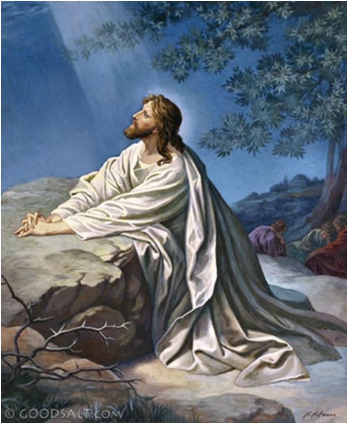
Christ in Gethsemane

զայն ու տարէ՛ք ապահովութեամբ»: Երբ ինք եկաւ՝ իսկոյն մօտեցաւ անոր եւ ըսաւ. «Ռաբբի՛, Ռաբբի՛», ու համբուրեց զայն: Եւ անոնք ձեռք բարձրացուցին անոր վրայ ու բռնեցին զայն: Քովը