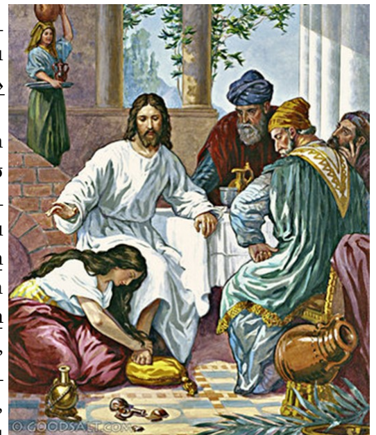
Mary Anoints Jesus' Feet

Բաղարջակերքի առաջին օրը, երբ կը մօրթէին գատիկը, անոր աշակերտները ըսին իրեն. «Ո՛ր կուզես որ երթանք պատրաստենք, որպէսզի ուտես գատիկը»: Իր աշակերտներէն երկուքը դրկեց եւ ըսաւ անոնց. «Գացէ՛ք քաղաքը, ու ձեզի պիտի հանդիպի մարդ մը՝ որ ուսին վրայ կը տանի ջուրի սափոր մը. հետեւեցէ՛ք անոր, եւ ո՛ր որ մտնէ՝ տանսիւրջ ըսէ՛ք. “Վարդապետը կըսէ. “Ո՛ր է իջեւանը, ուր պիտի ուտեմ գատիկը՝ աշակերտներու հետ”»: Ան ալ պիտի ցուցնէ ձեզի մեծ վերնայարկ մը՝ կահաւորուած ու պատրաստ. հո՛ն պատրաստեցէ՛ք մեզի»: Իր աշակերտները գացին, մտան քաղաքը, եւ ինչպէս իրենց ըսաւ՝ այնպէս գտան, ու պատրաստեցին գատիկը: