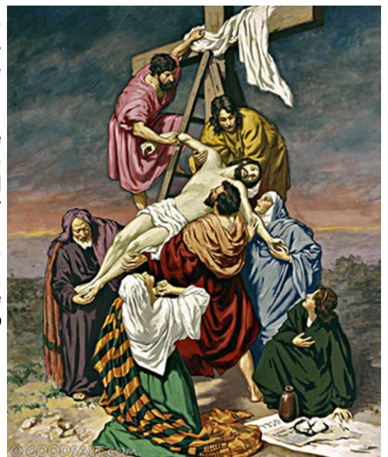
Christ Taken Down from Cross