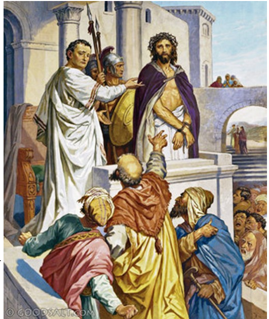
Pilate and Jesus

Տօնին ատենը բանտարկեալ մը կ'արձակէր անոնց, ո՛վ որ ուզէին: Մէկը կար՝ Բարաբբա կոչուած, կապուած իրեն հետ ապստամբողներուն հետ, որոնք մարդասպանութիւն գործած էին ապստամբութեան ատեն: Բազմութիւնը՝ գոռալով՝ սկսաւ խնդրել, որ ընէ՝ ինչպէս միշտ կ'ընէր իրենց: Պիղատոս պատասխանեց անոնց. «Կուգէ՞ք որ արձակեմ ձեզի Հրեաներուն թագաւորը». որովհետեւ գիտէր թէ քահանայապետները նախանձի՝ համար մատնած էին զայն: Բայց քահանայապետները գրգռեցին բազմութիւնը՝ որ ան փոխարէնը Բարաբբա՛ն արձակէ իրենց: Դարձեալ Պիղատոս ըսաւ անոնց. «Հապա ի՞նչ կ'ուզէք որ ընեմ անոր՝ որ կը կոչէք Հրեաներուն թագաւորը»: Անոնք դարձեալ աղաղակեցին. «Խաչէ՛ զայն»: Պիղատոս ըսաւ անոնց. «Բայց ի՞նչ չարիք ըրած է»: Անոնք ա՛լ աւելի կ'աղաղակէին.