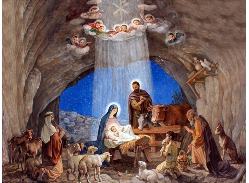
Birth of Christ

Յիսուս Քրիստոսի ծնունդը եղաւ սա՛ կերպով: Անոր մայրը՝ Մարիամ, Յովսէփի նշանուած, Սուրբ Հոգիէն յղացած գտնուեցաւ՝ դեռ իրարու քով չեկած: Յովսէփի՝ անոր ամուսինը, արդար մարդ ըլլալով, ու չուզելով որ խայտառակէ զայն, կը ծրագրէր ծածկաբար արձակել զայն: Մինչ ան ա՛յդպէս կը մտածէր, ահա՛ Տէրոջ հրեշտակը երեւցաւ անոր՝ երագի մէջ, եւ ըսաւ. «Յովսէփ, Դաւիթի՛ որդի, մի՛ վախնար քովդ առնել կիինդ՝ Մարիամը, որովհետեւ անոր մէջ յղացուածը Սուրբ Հոգիէն է: Ան պիտի ծնանի որդի մը, եւ անոր անունը Յիսուս պիտի կոչես, քանի որ ա՛ն պիտի փրկէ իր ժողովուրդը իրենց մեղքերէն»: Այս ամէնը կատարուեցաւ, որպէսզի իրագործուի մարգարէին միջոցով ըսուած Տէրոջ խօսքը. «Ահա՛ կոյսը պիտի յղանայ ու որդի պիտի ծնանի, եւ անոր անունը Էմմանուէլ պիտի կոչեն», որ կը թարգմանուի՝ Աստուած մեզի հետ: Յովսէփ քունէն արթննալով՝ ըրաւ ինչ որ Տէրոջ հրեշտակը հրամայեց իրեն, եւ քովը առաւ իր կինը: Ու չգիտցաւ զայն՝ մինչեւ որ ան ծնաւ իր անդրանիկ որդին. եւ անոր անունը Յիսուս կոչեց: