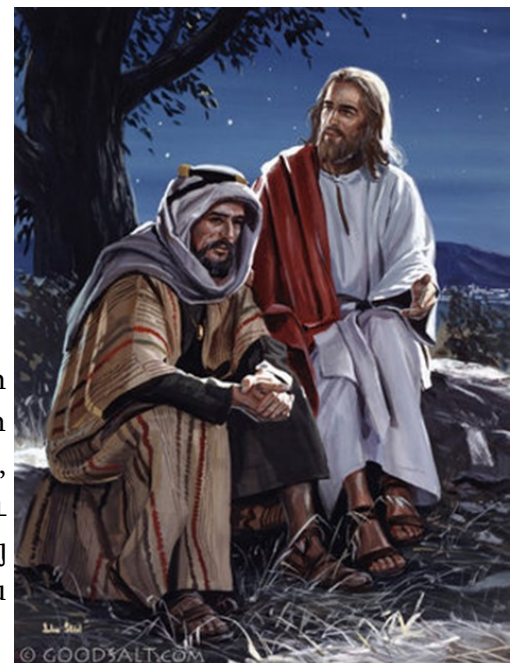
Jesus with man

Նիկողեմոս ըսաւ անոր. «Ի՞նչպէս կրնայ ծնիլ մարդ մը՝ որ ծերացած է: Կարելի՞ է, որ երկրորդ անգամ մտնէ իր մօր որովայնը եւ ծնի»: Յիսուս պատասխանեց. «Ճշմարտապէս, ճշմարտապէս կը յայտարարեմ քեզի. "Եթէ մէկը ջուրէն ու Հոգիէն չծնի՝ չի կրնար մտնել Աստուծոյ թագաւորութիւնը": Մարմինէն ծնածը՝ մարմին է, եւ Հոգիէն ծնածը՝ հոգի է: