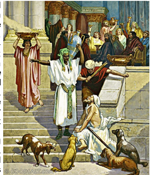
Lazarus and the Rich Man

Now the Pharisees, who were lovers of money, were listening to all these things and were scoffing at Him. And He said to them, “You are those who justify yourselves in the sight of men, but God knows your hearts; for that which is highly esteemed among men is detestable in the sight of God.