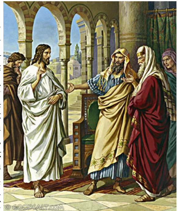
By What Authority I Do These Things

Դարձեալ եկան Երուսաղէմ: Երբ կը քալէր տաճարին մէջ, քահանայապետները, դպիրներն ու երէցները եկան անոր, եւ ըսին. «Ի՞նչ իշխանութեամբ կ'ընես այդ բաները. ո՞վ տուաւ քեզի այդ իշխանութիւնը՝ որ ընես այդ բաները»: Յիսուս պատասխանեց անոնց. «Ես ալ ձեզի՛ հարցնեմ բան մը. պատասխանեցէ՛ք ինծի, ու ես պիտի ըսեմ ձեզի թէ ի՞նչ իշխանութեամբ կ'ընեմ այդ բաները: “Յովհաննէսի մկրտութիւնը երկինքէ՛ն էր՝ թէ մարդոցմէ՛”: Պատասխանեցէ՛ք ինծի»: Անոնք կը մտածէին իրենց մէջ՝ ըսելով. «Եթէ պատասխանենք. “Երկինքէն”, պիտի ըսէ. “Հապա ինչո՞ւ չհաւատացիք անոր”: Իսկ եթէ պատասխանենք. “Մարդոցմէ՛ր”՝ »: Կը վախնային ժողովուրդէն, որովհետեւ բոլորը իրապէս մարգարէ կը նկատէին Յովհաննէսը: Ուստի պատասխանեցին Յիսուսի. «Չենք գիտեր»: Յիսուս ալ պատասխանեց անոնց. «Ես ալ չեմ ըսեր ձեզի թէ ի՞նչ իշխանութեամբ կ'ընեմ այդ բաները»: