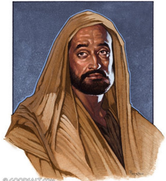
Paul Defends His Apostleship

Միթէ սխալ գործած եղայ ես զիս խոնարհեցնելով՝ որպէսզի դո՛ւք բարձրանաք, քանի որ ձեր քարոզեցի ձեզի Աստուծոյ աւետարանը. կողոպտեցի ուրիշ եկեղեցիներ՝ թոշակ առնելով անոնցմէ, որպէսզի սպասարկեմ ձեզի: Ձեր մէջ ներկայ եղած ատենս՝ երբ կարօտութեան մէջ էի, ձեզմէ ո՛չ մէկուն բեռ եղայ. որովհետեւ Մակեդոնիայէն եկող եղբայրներ լրացուցին ինչ որ կը պակսէր ինծի. եւ ամէն կերպով զգուշացայ ձեզի ծանրութիւն ըլլալէ, ու դարձեալ պիտի զգուշանամ: Քանի որ Քրիստոսի ճշմարտութիւնը իմ մէջս է, ո՛չ մէկը պիտի արգիլէ զիս այս պարծանքէն՝ Աքայիայի շրջանները: Ինչո՞ւ. քանի որ չե՞մ սիրեր ձեզ: Աստուած գիտէ: